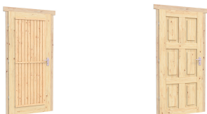
0.84×1.885 м. 0.84×1.885 м.