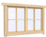
1.34×0.91 м.1 шт.