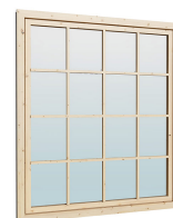
1.62×1.885 м.1 шт.