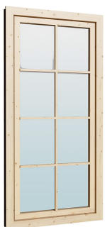
0.84×1.885 м.2 шт.