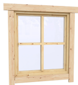
0.87×0.78 м.3 шт.