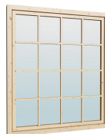
1.62×1.885 м.2 шт.