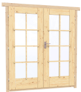
1.62×1.885 м.1 шт.

7. Наличники: сухая строганная доска 20×100 мм.;