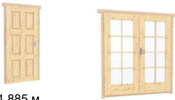
0.84×1.885 м. Межк. 3 шт. 1.62×1.885 м. 1 шт.

7. Наличники: сухая строганная доска 20×100 мм.;