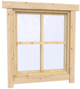
0.87×0.78 м.4 шт.